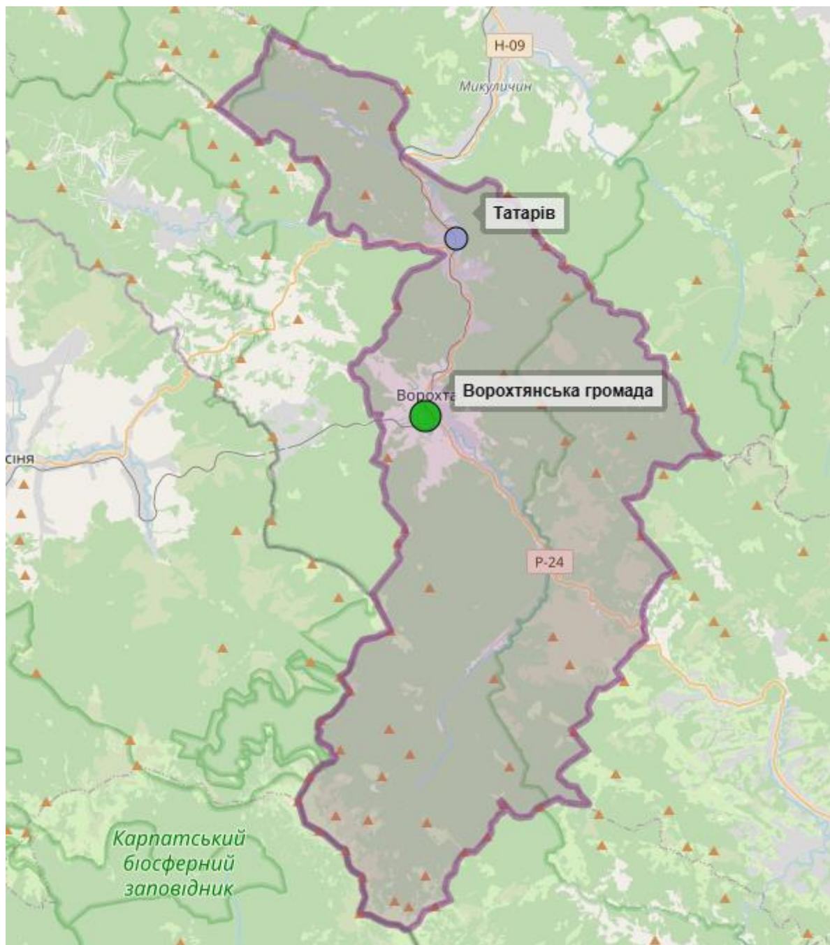
Схема розташування с. Татарів