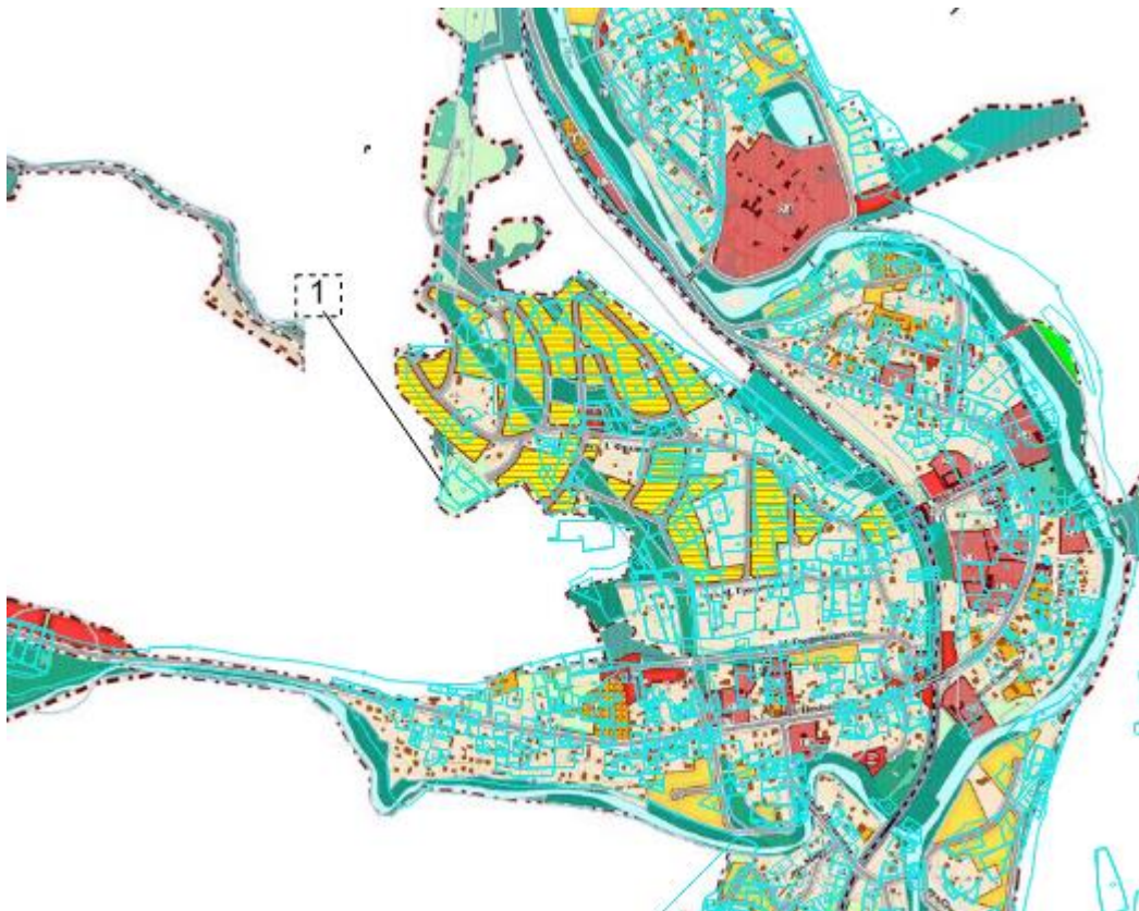
Схема розташування змін до Генерального плану с. Татарів суміщеного з детальними планами території в 2025 році

Розвиток території с. Татарів відповідає положенням містобудівної документації вищого рівня — обласних та районних програм соціально-економічного розвитку, а також стратегічним завданням щодо формування туристичного кластеру Карпатського регіону. Впровадження рішень здійснюється в координації із суміжними громадами та органами державної влади, зокрема щодо розвитку транспортної доступності та екологічної безпеки території.